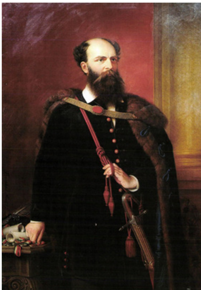
Barabás Miklós festménye, 1840. /Forrás: Barabás Miklós (1810, Kézdimárkosfalva – 1898, Budapest) https://www.hung-art.hu/index-hu.html /

Gróf németújvári Batthyányi Lajos, Magyarország miniszterelnöke 1848 március 17 és október 2 között