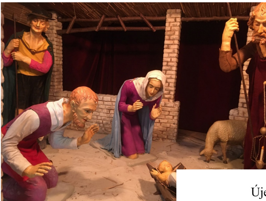
Kerbstallen in het Heiligenbeeldenmuseum in Kranenburg 2022