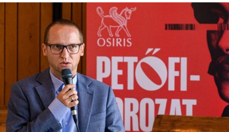
Fotó: MTI/Szigetváry Zsolt

Forrás: magyarnemzet.hu (Fotó: MTI/Szigetváry Zsolt)