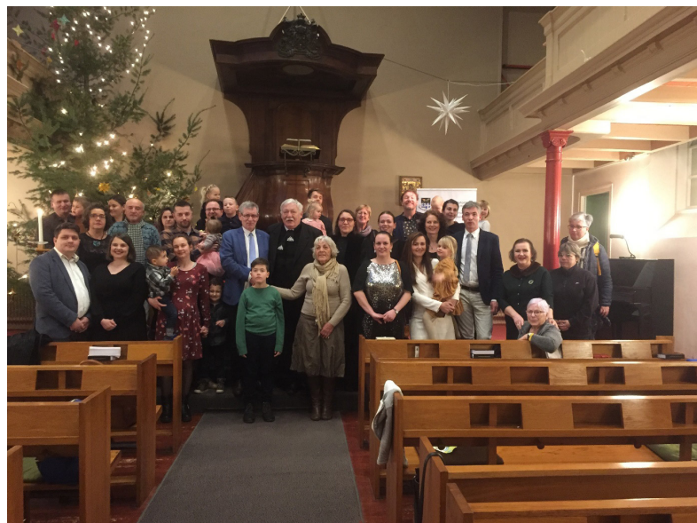
Zwollei Magyar Református Egyházközség istentisztelete 2022 december 25-én. A gyülekezet 42 tagja közül 28-an éltek az úrvacsorai szent jegyekkel.

Híveinknek és Barátainknak ezúton kívánunk Áldott Új Esztendőt! Az Úr Jézus Krisztus békessége és szeretete legyen mindnyájatokkal! Kívánjuk, hogy 2023-ban is testi-lelki épségben találkozhassunk. A viszontlátásig szívélyes üdvözléttel: a Presbitérium és a Szerkesztőség