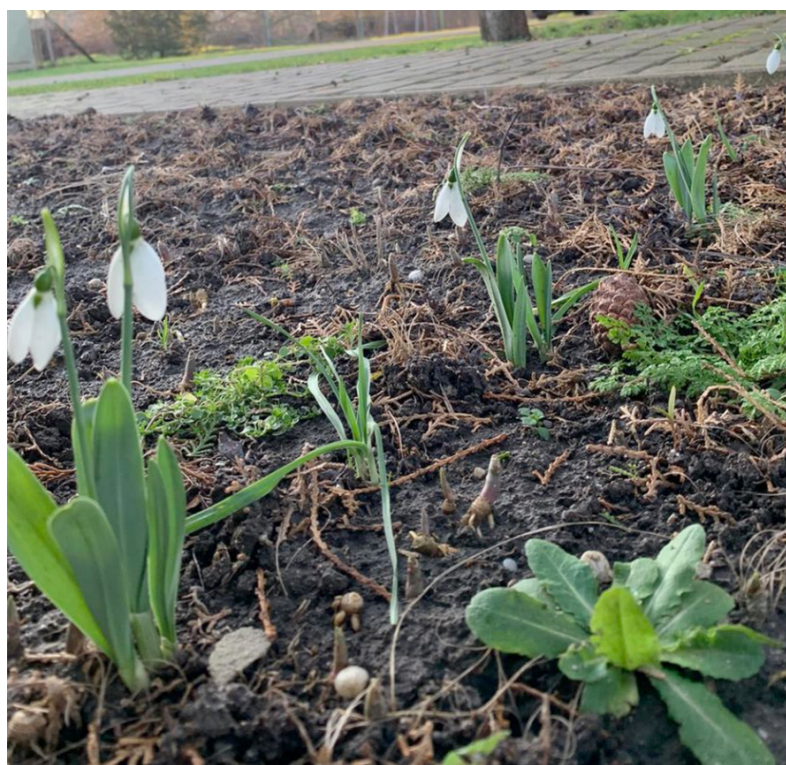
Templomkerti hóvirágok. Bátorkeszi, 2023 január 11.