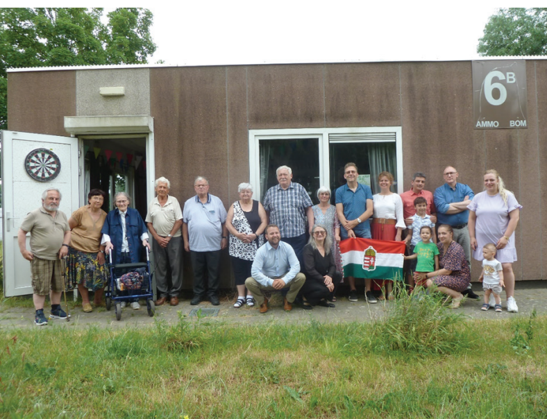
A hetedik vianeni istentisztelet csoportképe.