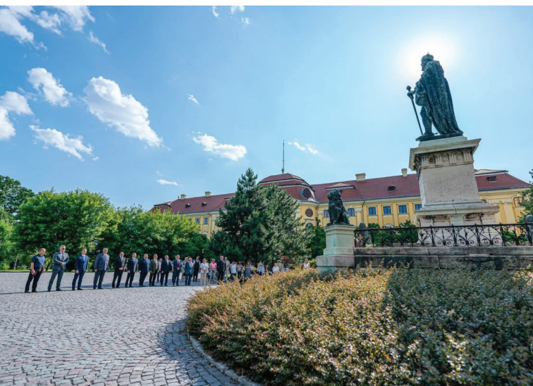
Koszorúzás és főhajtás a lovagkirály szobránál.

Több előrendezvényt követően június 19-én este a nagyváradi színházban tartott nyitógálával hivatalosan is elrajtolt a Partium fővárosának magyar polgári fesztiválja. A testvérváros Debrecenből érkezett Kodály Filharmonikusok centenáriumi operaműsora előtt a meghívott személyiségek és a házigazdák köszöntőbeszédei hangzottak el: Tőkés László, az Erdélyi Magyar Nemzeti Tanács elnöke, Szilágyi Péter, a magyar Miniszterelnökség nemzetpolitikáért felelős helyettes államtitkára, Puskás István, Debrecen alpolgármestere, Csomortányi István, az Erdélyi Magyar Szövetség alelnöke, Antonia Nica, Nagyvárad alpolgármestere, Zatykó Gyula főszervező szóltak a teátrumot megtöltő publikumhoz. A nyitógálán Fleisz János, az Erdélyi Magyar Közművelődési Egyesület régióelnöke átadta az EMKE díszoklevelét a fesztivált 11. alkalommal megszervező Szent László Egyesületnek. Alább Tőkés László EMNT-elnöknek, volt királyhágómelléki református püspöknek az ünnepi beszéde olvasható.