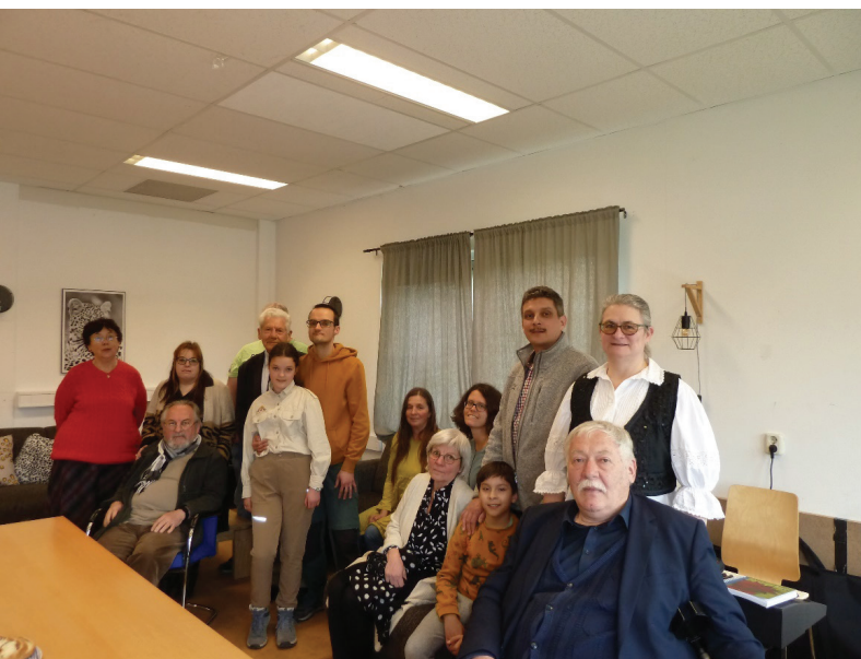
Vianen, az ötödik istentisztelet résztvevői, 2023. április 16