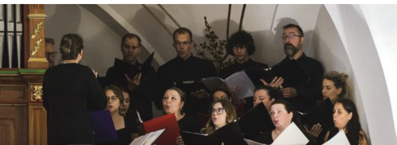
A Cantate Domino kórus szolgálata

„Mondhatjuk, van már múlt a keresztyéneknek az életében. S már ebben a levélben is érzékelhető, hogy míg a múlt az egyik oldalon ajándék, a másik oldalon teherként”. Kifejtette: Ajándék abban az értelemben, hogy az Isten megtartó hatalmát látjuk benne. Sokszor elhangzik ajkunkról: Tebenned bízunk eleitől fogva... Már van kezdet és van idő, amelyre hálával tekinthetünk vissza, s hálás lehet az ember Isten megtartó kegyelméért és hűségéért. „Ami számunkra a legnagyobb örömhír, az az, hogy Isten Krisztus által megkeresi és megtartja az elveszetettet” – nyomatékosította a püspök.