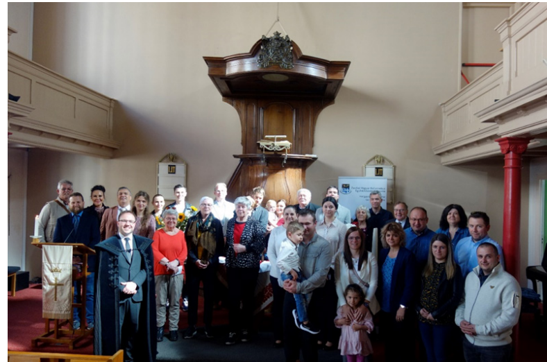
Húsvét másodnap i úrvacsorás istentiszteletünkre április 18-án került sor.

Szolgált nt. Kelemen Csongor.