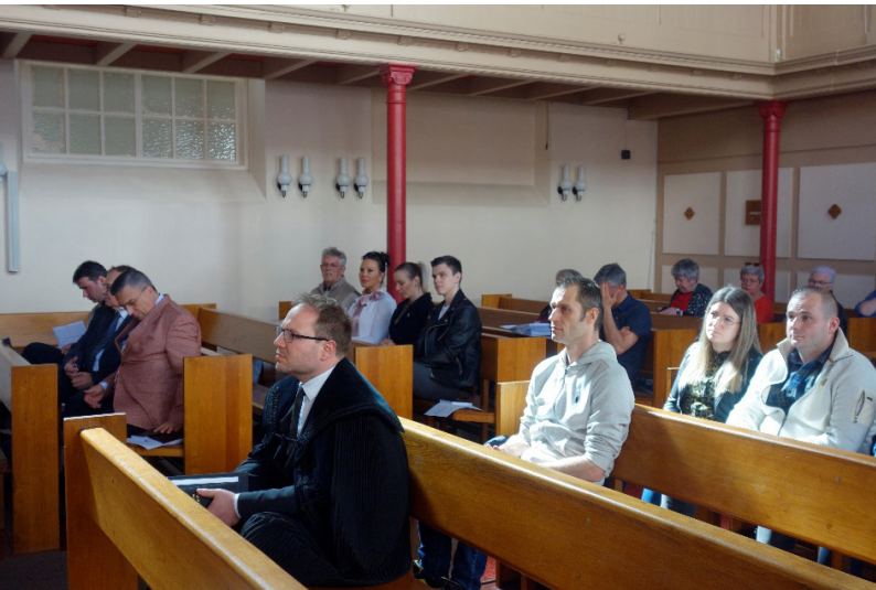
Húsvéti istentiszteletünk résztvevői.