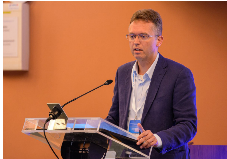
Hankó Balázs államtitkár a hittudományi képzés kovászszeréről beszélt.

Hankó Balázs innovációért és felsőoktatásért felelős államtitkár a felsőoktatás egy különleges területe, a hittudományi képzés címmel tartott előadást, amelyben arról is beszélt, hogy a hittudományi képzések hogyan tudnak kovászként hatni a nemzetben az egyetemek révén.