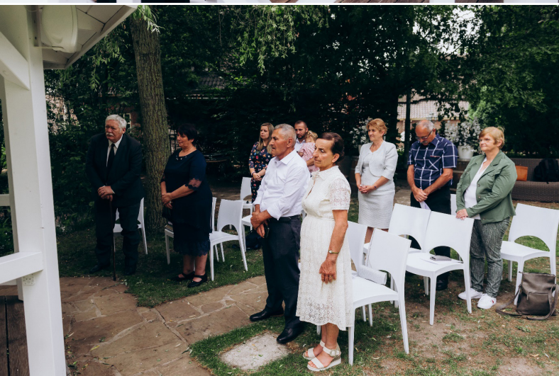
A szabadtéri esküvő kárpátaljai résztvevői