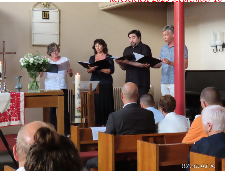
Hágai Magyar Énekkar szólistái 2023 szeptember 10-én