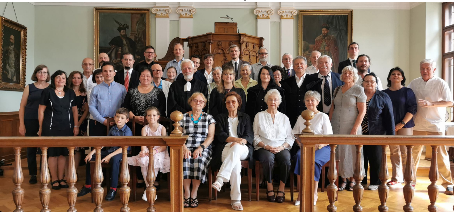
Kolozsvári Teológia díszterme, 2023 szeptember 3.