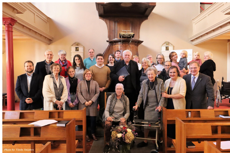
Istentisztelet résztvevői 2022 október 9-én