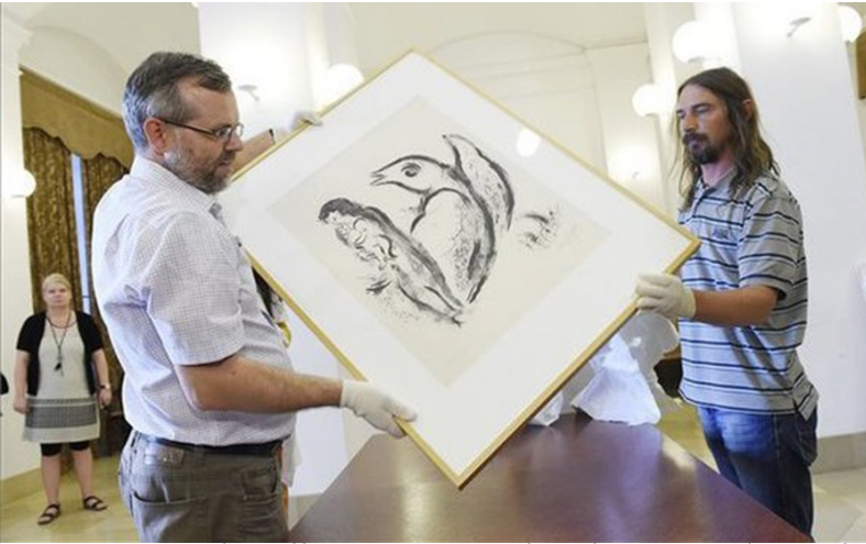
Marc Chagall: Anya gyermekével ---Rejt/Jel/Képek ,56 - A forradalom titkos művészete

A nizzai Musée National Marc Chagall által kölcsönzött grafika Magyarországon még sosem volt látható; az MMN művészettörténésze, Gödölle Máttyás hosszú kutatás után bukkant rá a nizzai múzeum katalógusában. Az 1956-os keltezésű képen békegalamb óv egy gyermekét ölelő anyát egy égő város mellett.